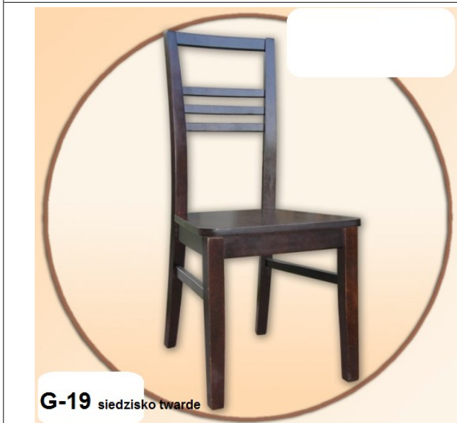
G-19 siedzisko twarde