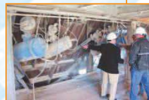
Komora wlotu pieca