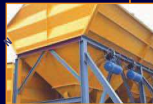
Wytwórnia prefabrykowanej masy betonowej – piasek

Nie pozwól by zatkane wyloty i oklejone ściany zbiornika zmniejszyły Twoją wydajność!