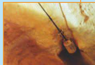
GIRONET® wewnątrz silosu