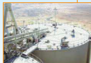
Czyszczenie silosów dowolnych rozmiarów